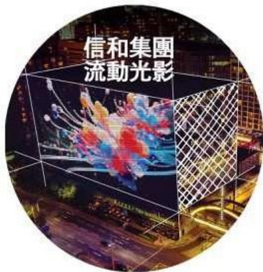
信和光影藝術幕牆 24.3 – 5.5.2024