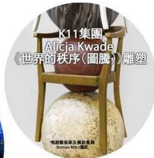
K11 MUSEA 海濱長廊 23.3 – 11.2024