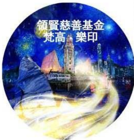
香港文化中心露天廣場 28.3 – 31.5.2024